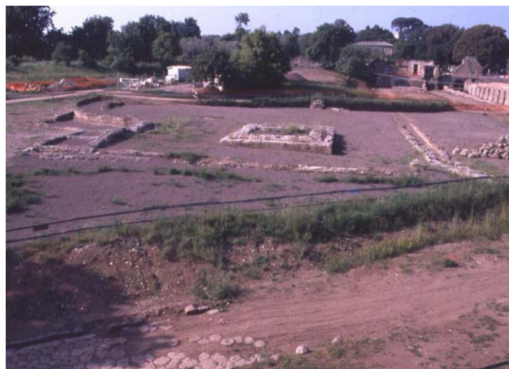
Fig. 4. Veduta dell'Antinoeion