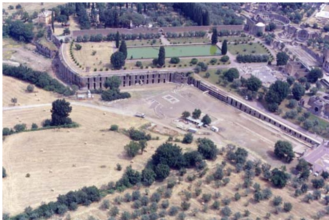
Fig. 2. Panoramica dello scavo davanti alle Cento camerelle.

Di eccezionale importanza sono i reperti in stile egittizzante rinvenuti negli accumuli di superficie e nell'interro delle fosse e del canale. Il più notevole è un frammento di statua seduta, importata dal delta del Nilo (Memphis?), in granito grigio del faraone Ramesse II (1290-1224), recante un'epigrafe dorsale con elenco dei titoli reali. Degni di nota sono anche vari frammenti di sculture in marmo bigio morato a soggetto umano e animale (arti, plinti), tra cui spiccano una pregevole testa femminile con i capelli raccolti nel nemes e uraeus sulla fronte e la coda di uno spartivero; a una statua o gruppo colossale spetta un grosso elemento in marmo bianco. Alla decorazione dell'area dell'edera possono inoltre essere riportati tronchi di raffinate colonne tortili in marmi multicolori.