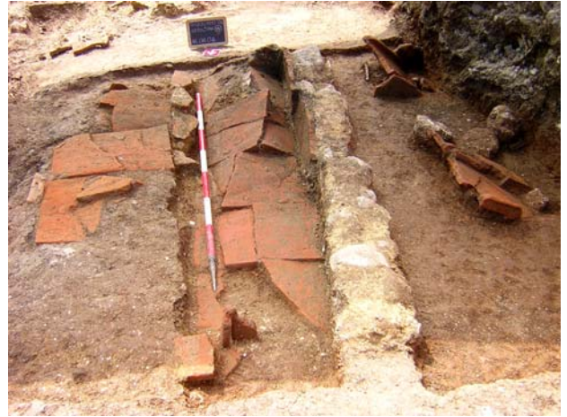
Fig. 11. La sepoltura M, 32