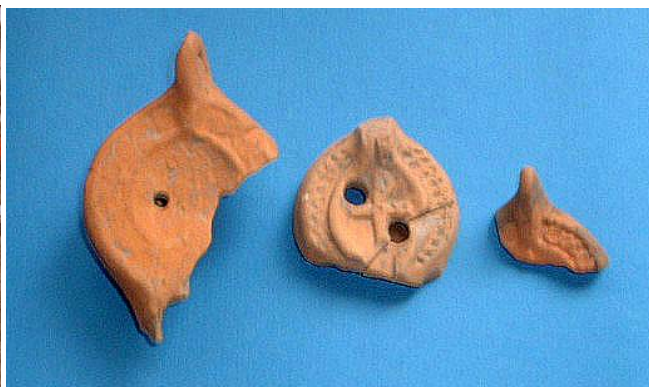
Fig. 8. Le lucerne

Nel tratto meridionale del muro contrassegnato dalla US 22 avente direzione N-S si trovano due blocchi di forma parallelepipedica a delimitare l'apertura di un vano. Ad essi si lega un piano di mattoni allettati su malta (US 13), cioè uno strato preparatorio pavimentale sul quale doveva giacere una soglia asportata. L'apertura sembra essere coeva con la II fase costruttiva.