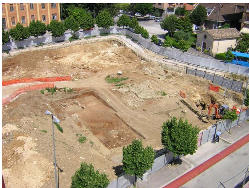
Fig. 5. L'area dello scavo

murarie a definire un ambiente absidato (fig. 7) (USM 35, 36) chiuso a sua volta da altre murature ortogonali. Dal punto di vista cronologico importante è stato il ritrovamento nel taglio di fondazione di uno di questi muri di un nummus dell'Imperatore Valente (375-378 d.C.) 11