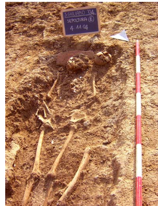
Fig. 16. La sepoltura con olla

deposizione, sicuramente con valore apotropaico. Interessante è un piccolo cornetto portafortuna in argento trovato sull'inumato della sepoltura C-24 (fig. 17). Gli accessori dell'abbigliamento maschile e femminile confermano anche a Sora la presenza dell' inhumation habillé anche in ambito cristiano, per altro già ampiamente attestato a Tharros e Cornus in Sardegna, ad Amiternum in Abruzzo, a Cimitile in Campania. La consuetudine di vestire il defunto con gli abiti che usava in vita, e di posizionare all'interno della tomba oggetti appartenutigli, si diffonde in vaste proporzioni a partire dal VI secolo; il vasellame aveva soprattutto una valenza rituale, associata o meno al corredo personale 26 .