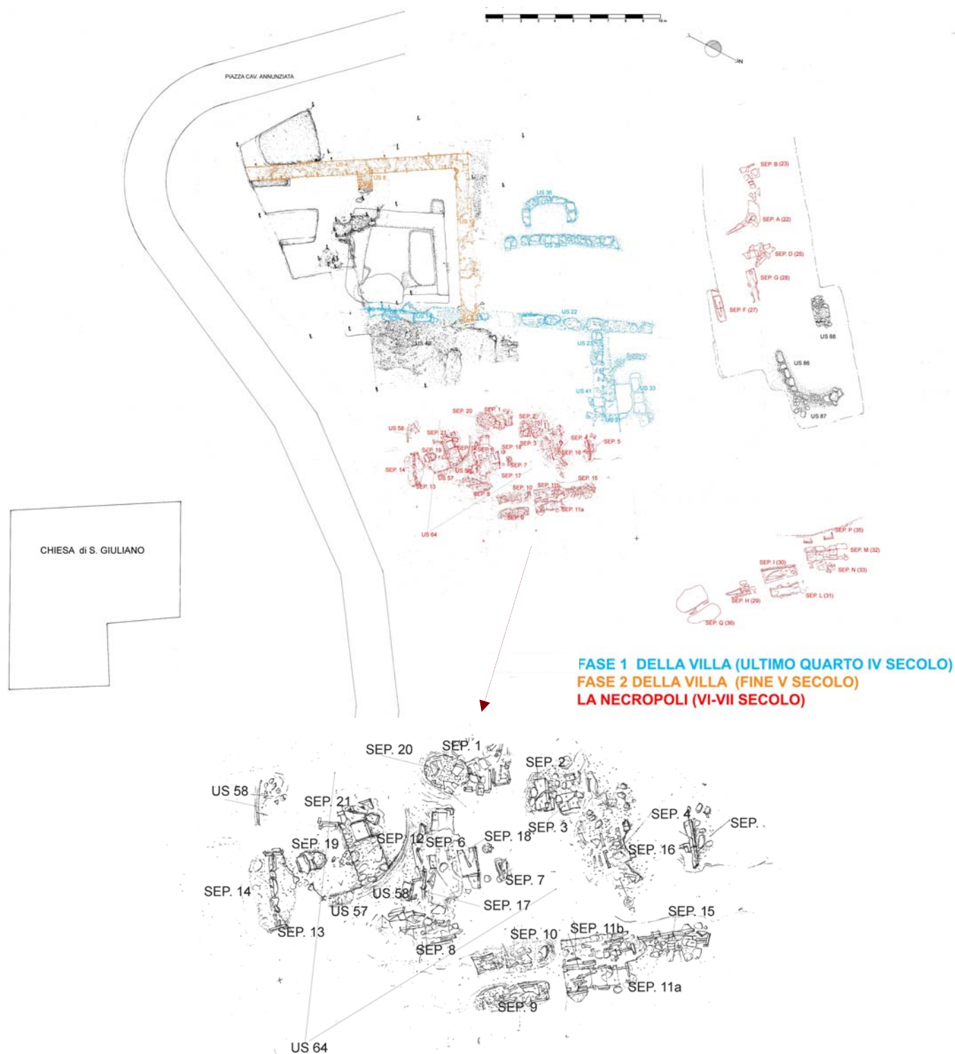
Fig. 6. Planimetria dello scavo, strutture murarie antiche e sepolture. In basso particolare del gruppo di sepolture situate sul lato orientale. Soprintendenza Beni Archeologici del Lazio. Rilievo e disegno di G. Troja.

Nel settore meridionale le due fondazioni ortogonali principali sono costruite in muratura a sacco di conci irregolari e mattoni riutilizzati, forse di epoca di poco posteriore ai precedenti: indicazioni cronologiche sono rese dal ritrovamento di frammenti pertinenti a lucerne in argilla rossa del tipo Provoost 9B, databili tra il 450 ed il 500 d.C. 12 (fig. 8).