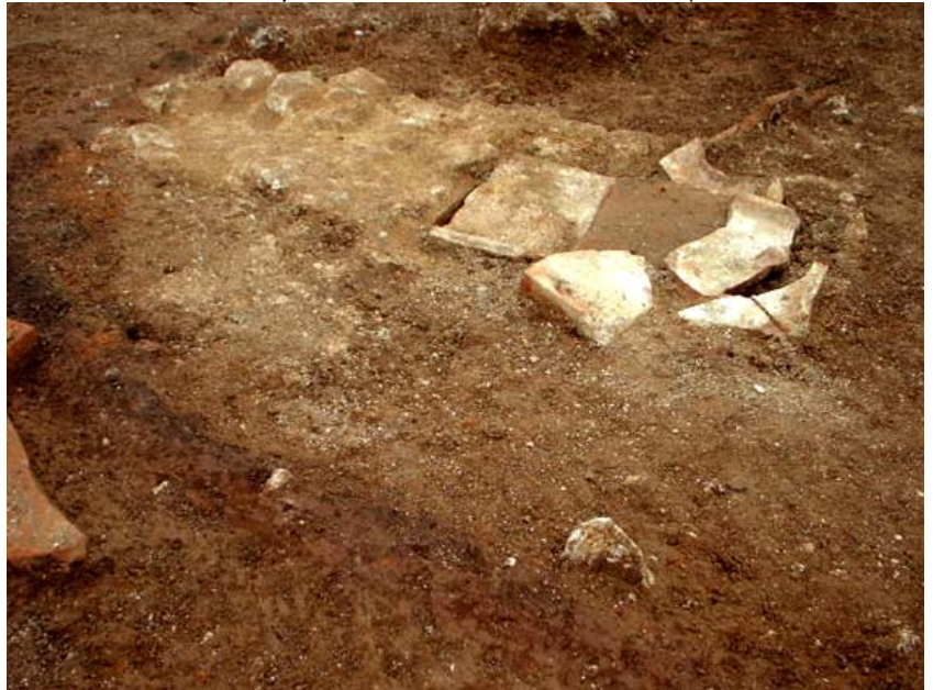
Fig. 18. La fossa con scarico ceramico

La presenza della villa e dello spazio cimiteriale in quest'area suburbana potrebbe essere messa in relazione con la presenza di una strada romana glareata scoperta nella primavera scorsa durante i lavori di costruzione di un centro polifunzionale nello spazio ex-mobilificio Tomassi, situato nell'isolato immediatamente ad Ovest di Piazza Annunziata. Il tratto, lungo per circa