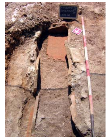
Fig. 12. La sepoltura L, 31

destinazione funeraria. Sulla superficie superiore di un frammento è presente un segno inciso a crudo con la stecca (vi si riconosce una sorta di A), probabilmente per favorire l'allettamento della malta. Molto interessante è anche la tegola proveniente dalla sepoltura P con bollo circolare decorato con immagine di un angelo con spada