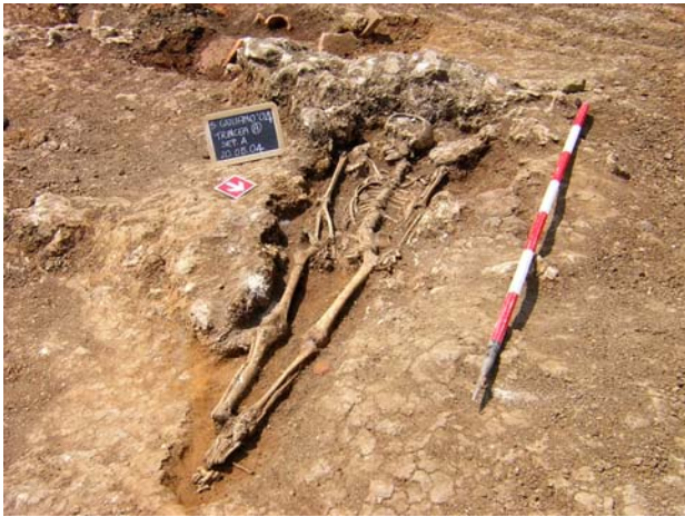
Fig. 10. La sepoltura A, 22

di Masseria Ciccotti 20 , queste due ultime in Basilicata. Il settore settentrionale destinato invece alle attività produttive, la pars rustica , e a quelle per il deposito e la conservazione delle derrate alimentari, la pars fructuaria , a tecnica mista di muratura e legno (testimoniata dalla buca di palo). Si spera che gli scavi in corso possano fornire dati maggiormente definitivi riguardo a questo punto.