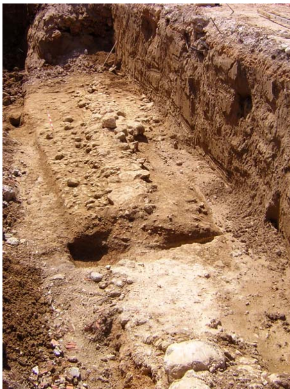
Fig. 19. Tratto di strada romana

I ritrovamenti venuti alla luce grazie alla fattiva collaborazione tra Comune di Sora e Soprintendenza per i Beni Archeologici del Lazio, hanno permesso di scoprire un momento interessante dello sviluppo urbanistico della città antica, fornendo dati nuovi e importanti, che si aggiungono ai ritrovamenti degli anni '70 del XX secolo avvenuti nel sottosuolo della cattedrale dedicata a S. Maria Assunta 28 . Le antiche strutture riemerse e recuperate attendono di essere restituite alla cittadinanza come fondamentale patrimonio storico e culturale.