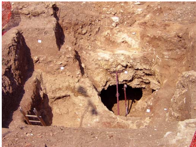
Fig. 9. La cavità sotterranea

Benché sia scarsa la conservazione dei resti che rende difficile il riconoscimento della planimetria, il complesso si può così suddividere in diverse destinazioni d'uso: il settore meridionale, dal quale sono emerse le strutture di consistenza e dimensioni maggiori, ed i materiali di rivestimento marmoreo, con funzione abitativa e residenziale (la cd. pars urbana secondo la definizione che ne dà Columella alla fine del I secolo d.C. 15 ), con particolare riferimento all'ambiente absidato, che sebbene non in posizione dominante rispetto all'asse del complesso, ne doveva significativamente rappresentare il cuore, come avvenne in esempi analoghi al nostro, espressi dalle ville di Desenzano 16 , di Avicenna a Piano di Carpino (FG) 17 , di Palazzo Pignano a Cremona 18 , di S. Giovanni di Ruoti 19 e