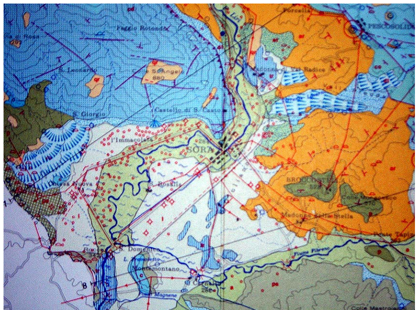
Fig. 3. Carta geologica del bacino sorano

L'indagine ha permesso di mettere in luce, a livello di spiccato di fondazione, strutture murarie pertinenti ad un complesso edilizio interpretabile come un impianto rustico-residenziale, che si sviluppa nel settore Ovest del cantiere. Immediatamente ad Est dell'edificio è un'area cimiteriale che consta,