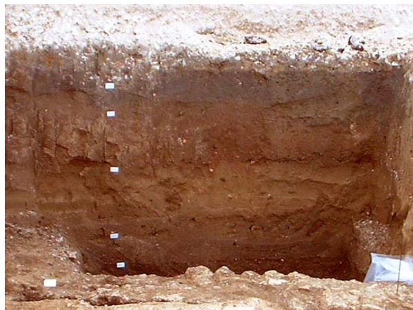
Fig. 4. La stratigrafia in parete

Tutta l'area presenta un consistente interrimento profondo da 2,00 a 2,80 metri: la successione stratigrafica evidenziata in parete lungo i limiti di scavo indica la presenza di almeno 3 fasi relative a momenti di sedimentazione di tipo alluvionale in seguito ad esondazioni fluviali (il Liri dista ca. 150 metri in linea d'aria) facilmente riconoscibili in parete (fig. 4), coperta direttamente dagli strati preparatori della pavimentazione moderna della piazza. Si tratta di strati limosi di colore variabile dal grigio, al marrone, al giallo, con poco materiale incoerente (blocchi lapidei e frammenti laterizi). Essi sono intervallati da altrettanti microstrati di "assestamento" antropizzati (sono contrassegnati dalle US 1, 2, 3).