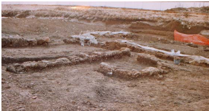
Fig. 7. L'ambiente absidato

All'interno ed all'esterno dei muri è visibile una serie di crolli edilizi ad essi pertinenti, che evidenziano un consistente stato di repentina distruzione ed abbandono del sito già in epoca antica. Concentrati nella zona meridionale sono stati recuperati numerosi frammenti in marmo (spessore variabile tra cm 1 e 1,80), elementi dell'apparato decorativo della villa.