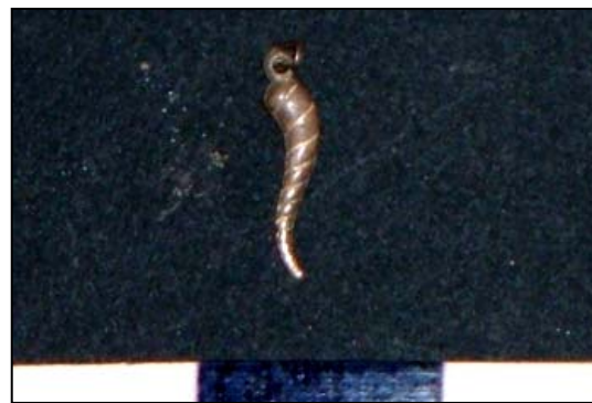
Fig. 17. Piccolo corno portafortuna in bronzo

deposizione, sicuramente con valore apotropaico. Interessante è un piccolo cornetto portafortuna in argento trovato sull'inumato della sepoltura C-24 (fig. 17). Gli accessori dell'abbigliamento maschile e femminile confermano anche a Sora la presenza dell' inhumation habillé anche in ambito cristiano, per altro già ampiamente attestato a Tharros e Cornus in Sardegna, ad Amiternum in Abruzzo, a Cimitile in Campania. La consuetudine di vestire il defunto con gli abiti che usava in vita, e di posizionare all'interno della tomba oggetti appartenutigli, si diffonde in vaste proporzioni a partire dal VI secolo; il vasellame aveva soprattutto una valenza rituale, associata o meno al corredo personale 26 .