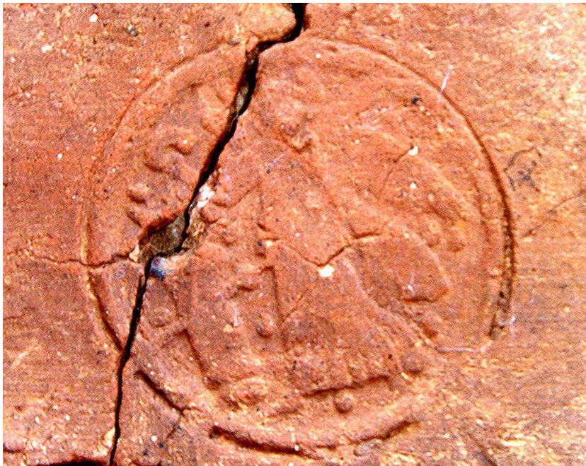
Fig. 15. Tegola con bollo decorato

L'uso cimiteriale dell'area dovette iniziare nel corso del VI secolo perdurando per tutto il VII, come si può dedurre dai pochi corredi rinvenuti: limitati sono gli accessori, costituiti da coppette di vetro, monete con significato di obolo di Caronte, una piccola olla di ceramica comune posta sul lato sinistro del cranio di una tomba recentemente scoperta e non ancora scavata (fig. 16). Ma la maggior parte dei materiali rinvenuti appartiene all'ornamentazione personale: si tratta di piccoli oggetti in bronzo (bracciali e anelli, bottoni, una fibula, pendagli, un ago crinale); numerosi chiodi, di cui almeno uno per