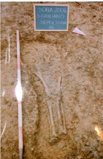
Fig. 14. La sepoltura n. 16

Delle tombe scavate 15 sono terragne delimitate da muretti a secco di piccole bozze sui lati lunghi e copertura tipo a cappuccina o con tegole piatte (fig. 11), 13 a cassa di tegole (fig. 12), 6 a cassa in muratura e copertura con tegole a spiovente o orizzontali (fig. 13), 5 terragne (fig. 14), 1 in alloggiamento nel banco naturale 22 . Le tegole utilizzate sembrano essere in parte materiale di recupero, (tra esse un frammento di tegola romana con bollo rettangolare poco leggibile: si riconosce all'inizio una N), e in parte prodotti seriali di figline locali, con probabile