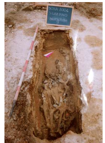
Fig. 13. La sepoltura 9