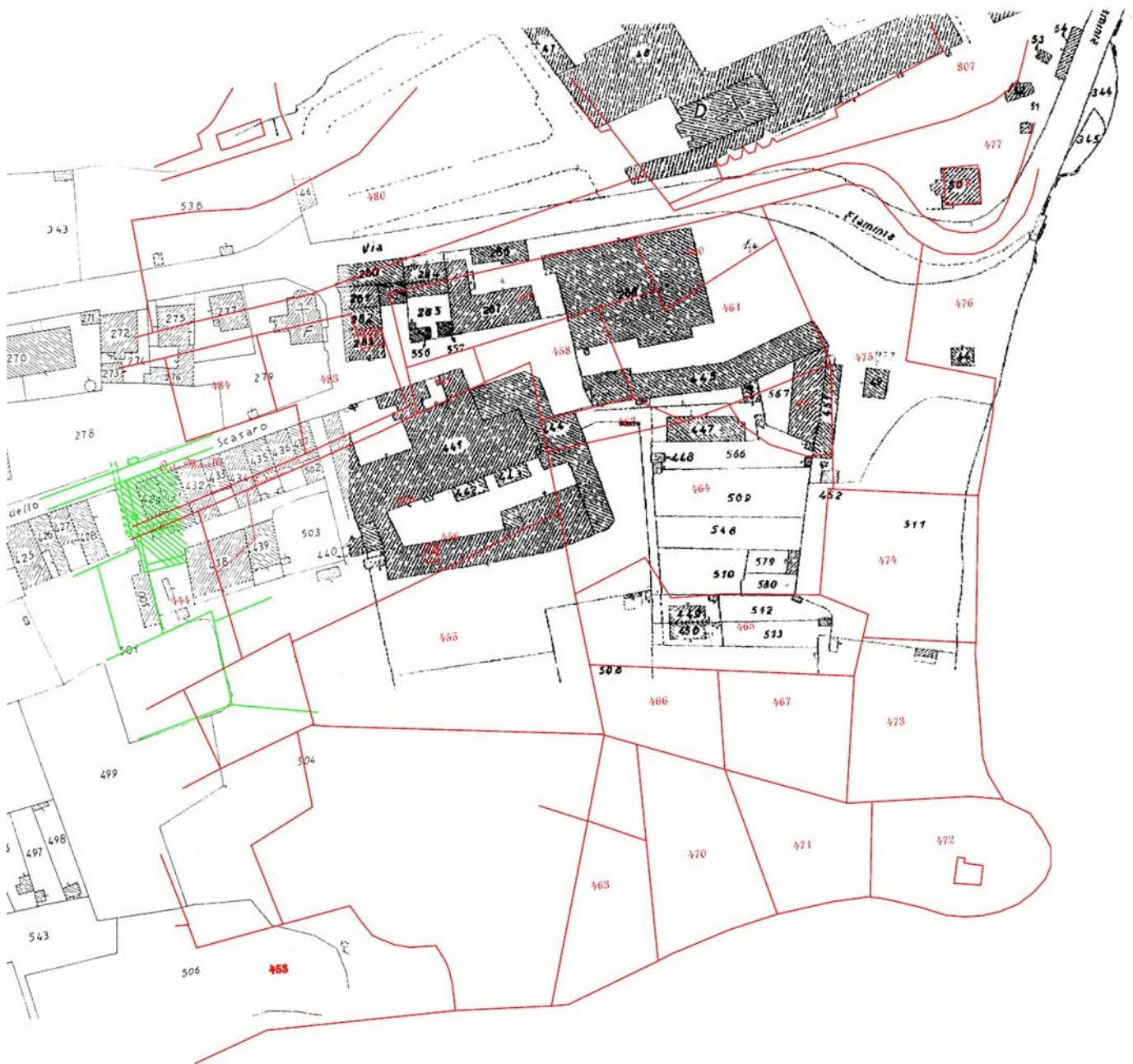
Fig. 3. Scasato. Stralcio Foglio catastale n° 30 (Scala 1:1000). In rosso l'antico Catasto Gregoriano.

Ancora ad ambito funerario è ascrivibile una fossa individuata nel settore B, US 32; è orientata nord-ovest/sud-est, di forma rettangolare e con frontoncino lungo la parete corta meridionale, munita di una risega lungo il lato occidentale