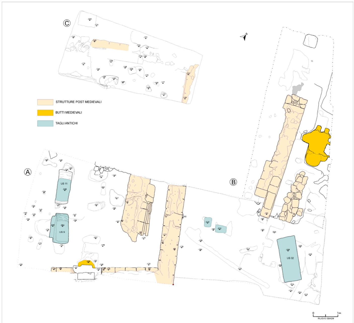
Fig. 2. Scasato. Planimetria dell'area di scavo.

Per motivi logistici non è stato possibile eseguire uno scavo estensivo e le ricerche si sono dovute limitare, in questa prima fase, al piccolo piazzale alle spalle della fabbrica, utilizzato per le attività artigianali ancora presenti in loco e il transito di veicoli privati. Si è proceduto per saggi, denominati A-B-C, aperti in successione e progressivamente chiusi, dopo aver eseguito la necessaria documentazione grafica e fotografica (fig. 2).