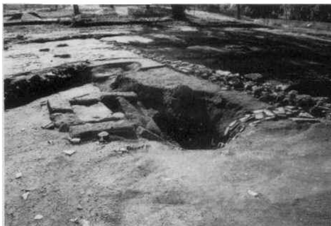
Fig. 5. Colli di Enea (RM). Ambiente U. Vasca costituita da blocchi di tufo di recupero (da Panella-Pompilio 2003, 199, fig. 5).