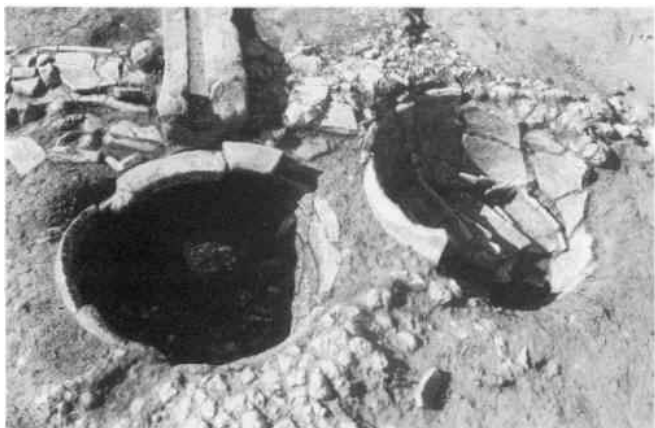
Fig. 3. Colli di Enea (RM). Ambiente D. Dolia appoggiati sul piano pavimentale (da Panella-Pompilio 2003, 199, fig. 3).

L'insieme degli impianti idraulici documentati e i rinvenimenti fittili - soprattutto i pesi da telaio - permettono di ipotizzare che questo edificio, nella sua seconda fase di occupazione, ospitasse alcune delle attività legate agli articolati processi della lavorazione delle fibre naturali (lana, lino ecc.). In particolare è possibile immaginare la tessitura, la follatura e la tintura delle fibre e/o dei tessuti. Gli ambienti occupati dai dolia e dalle vasche potrebbero aver ospitato le attività di follatura e tintura delle materie prime e dei manufatti finiti, mentre gli ambienti F e G potrebbero essere stati destinati a contenere i telai per la tessitura.