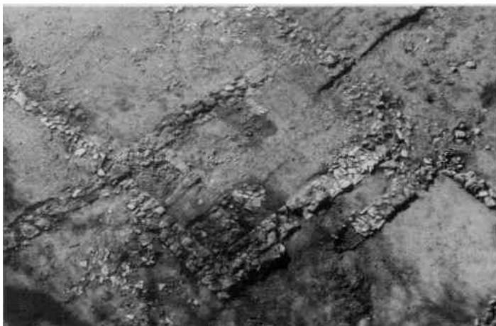
Fig. 4. Colli di Enea (RM). Ambiente R. Intercapedine di seconda fase (da Panella-Pompilio 2003, 199, fig. 4).

L'insieme degli impianti idraulici documentati e i rinvenimenti fittili - soprattutto i pesi da telaio - permettono di ipotizzare che questo edificio, nella sua seconda fase di occupazione, ospitasse alcune delle attività legate agli articolati processi della lavorazione delle fibre naturali (lana, lino ecc.). In particolare è possibile immaginare la tessitura, la follatura e la tintura delle fibre e/o dei tessuti. Gli ambienti occupati dai dolia e dalle vasche potrebbero aver ospitato le attività di follatura e tintura delle materie prime e dei manufatti finiti, mentre gli ambienti F e G potrebbero essere stati destinati a contenere i telai per la tessitura.