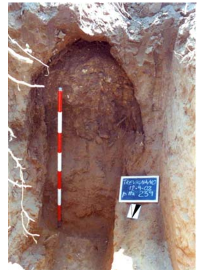
Fig. 6. Saggio C. Tratto del cunicolo scavato nel banco di Tufo di Aguscello.