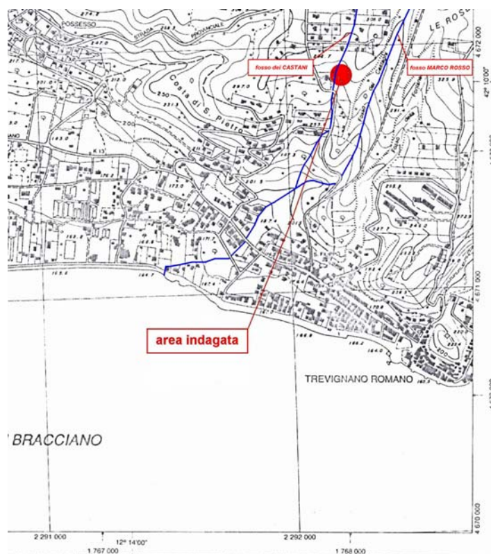
Fig. 1. Stralcio della C.T.R., sez. 364030 (originale in scala 1:10.000).

Data la totale ostruzione della galleria (in questo punto alta m 1.50 e larga m 0.70, all'imposta, e 0.44, alla base) si è ritenuto di eseguire alcuni sondaggi lungo il suo percorso.