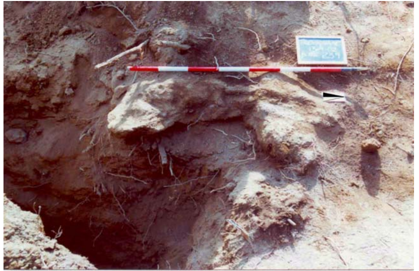
Fig. 8. Taglio (puteus) nel banco di Tufo di Aguscello presso il limite nord del saggio D.