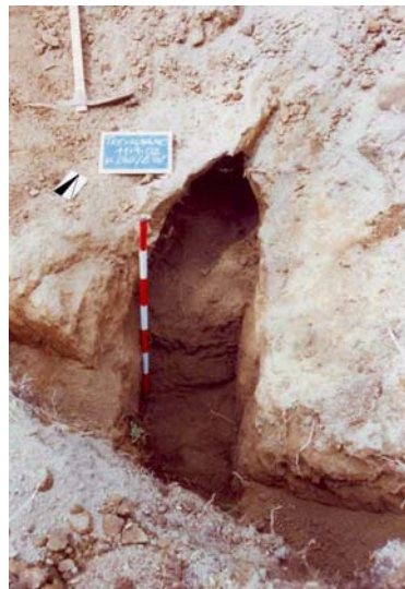
Fig. 5. Saggio B. Tratto del cunicolo rinvenuto in corrispondenza del saggio clandestino.