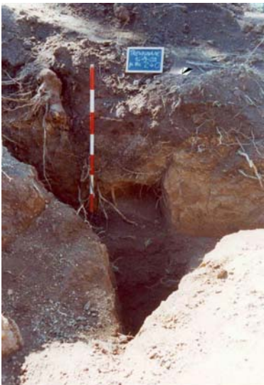
Fig. 4. Intervento clandestino intercettato lungo la trincea A.

La cronologia dell'infrastruttura idrica rimane, al momento, assolutamente incerta. Un frammento di terra sigillata italica, rinvenuto nel riempimento del bacino di raccolta, pertinente ad una coppa emisferica con fondo piatto ( Atlante forma XXXIV, v. 7), prodotta in età augustea 14 , fornisce un terminus post quem per il suo abbandono.