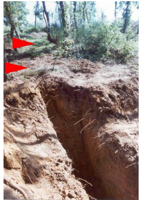
Fig. 12. Fianco SE del pianoro. Le frecce indicano la possibile linea di dispiuvio verso il bacino di raccolta.