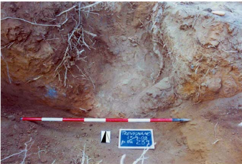
Fig. 9. Saggio L. Spartiacque contiguo al bacino di raccolta.