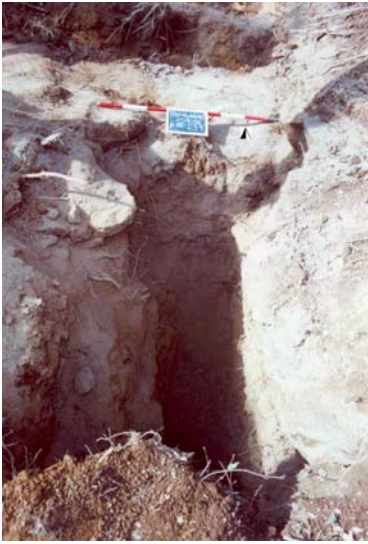
Fig. 7. Saggio D. Tratto del cunicolo scavato nel banco di Tufo di Aguscello e Tufi stratificati varicolori de La Storta.