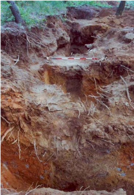
Fig. 11. Saggi I, L, D. Asse principale del sistema idraulico di raccolta e incanalamento.