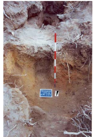
Fig. 10. Saggio L. Condotto ipogeo d'immissione scavato a ridosso del fronte settentrionale del cunicolo.