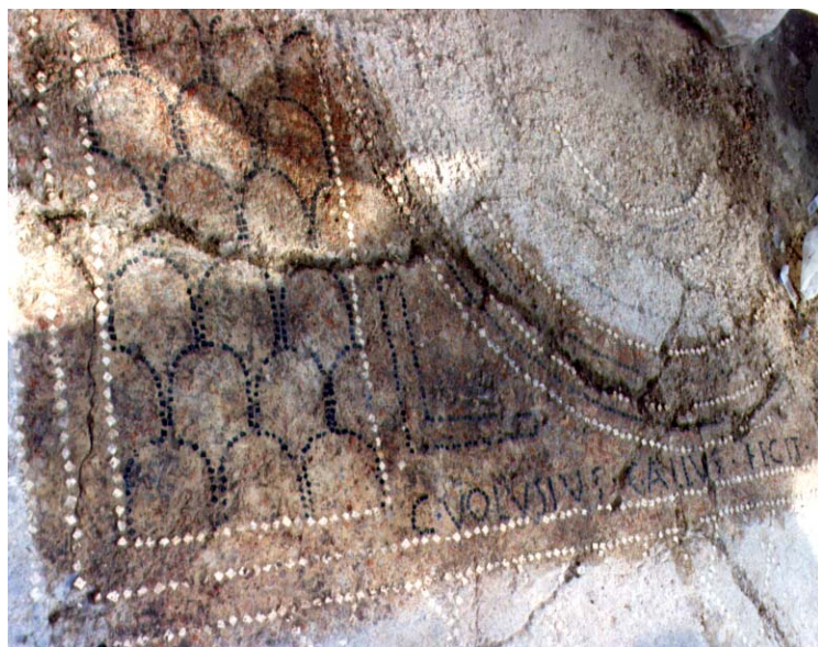
Fig. 3. Morrone del Sannio Casalpiano. Pavimento musivo con iscrizione.