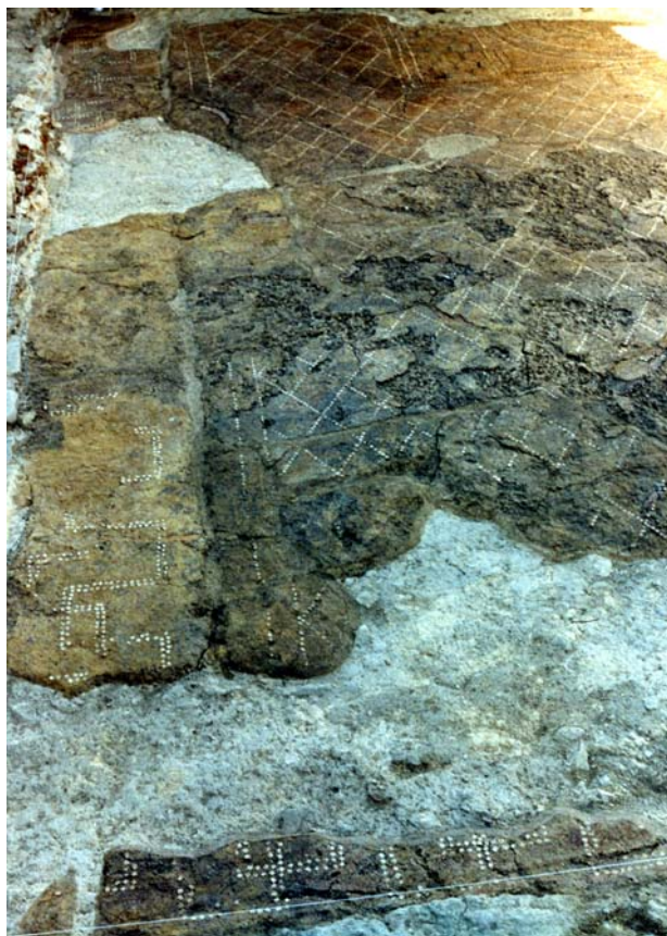
Fig. 2. Morrone del Sannio Casalpiano. Pavimento in opus signinum .

Informazioni sui proprietari della villa sono fornite da tre iscrizioni. Al centro di un ambiente, sul pavimento musivo, tagliato dall'edificio diruto della chiesa maggiore, è stata rinvenuta l'iscrizione C(aius) VOLVSIVS GALLVS FECIT (fig. 3). La gens Volusia è attestata con frequenza a Roma, in Campania, sulla fascia adriatica dal Picenum all' Apulia e verso i confini interni ( Telesia , Amiternum ) della regio IV (Samnium) 2 . Su un'ara votiva in pietra calcarea era riportata la dedica di un liberto – C. Salvius Euthychus - ai Lari Casanici per il ritorno della padrona Rectina 3 . Resta al momento una pura ipotesi l'identificazione, che ne è stata proposta, con il personaggio scampato all'eruzione del Vesuvio del 79 d.C. e salvato da Plinio il Vecchio, comandante della flotta di stanza al capo Miseno (Plinio, Epistulae , VI, 16) 4 . Dalla stessa area proviene anche un'iscrizione funeraria in cui compare la gens Anicia , di rango senatorio attestata a Roma in età imperiale