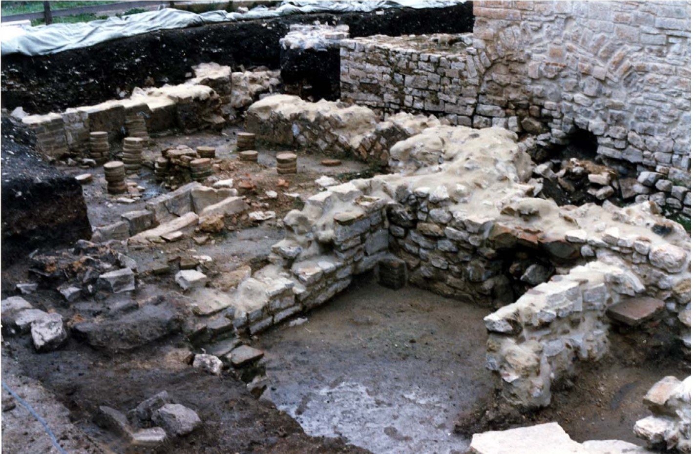
Fig. 4. Morrone del Sannio Casalpiano. Ambienti termali dell'insediamento rustico.

oggetti rinvenuti sono riferibili all'abbigliamento del defunto (fibbie in bronzo e in ferro) e raramente sono costituiti da suppellettile vascolare, ornamenti (bracciali in bronzo, perle in pasta vitrea) e monete, databili dalla fine del VI/VII secolo d.C.