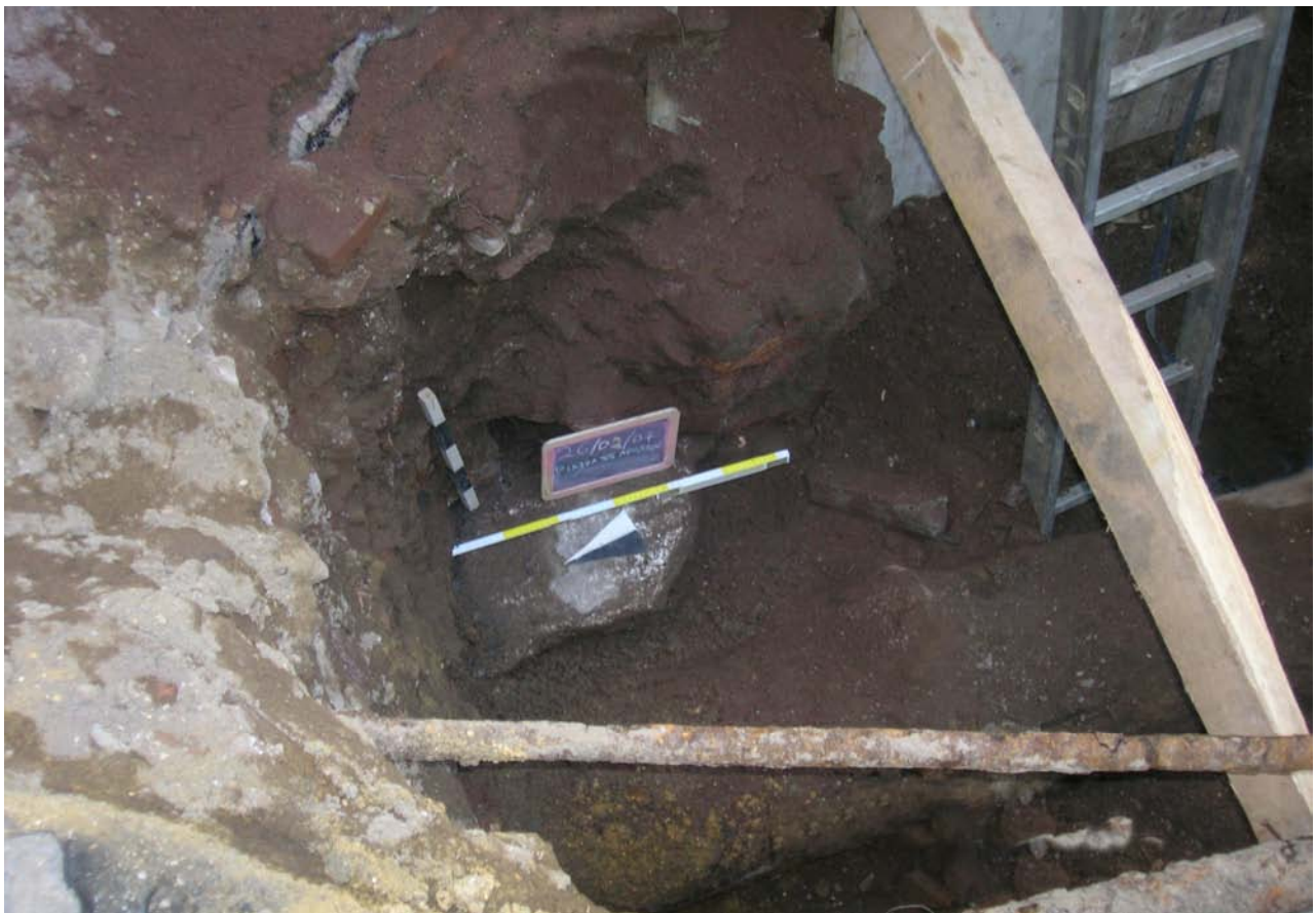
Fig. 8. Il blocco di travertino e la sezione Est del muro Nord visti dall'alto.