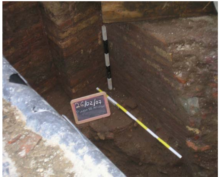
Fig. 5. Il muro Nord.

chi di tufo di forma squadrata, si alternano regolarmente a più strati di mattoni (rapporto mattoni tufelli è qui 3x1) con un'esecuzione molto accurata che vede l'uso della stilatura orizzontale e verticale della malta (fig. 9) 1 .