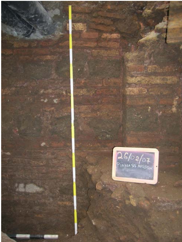
Fig. 4. Il muro Ovest con il muretto angolare. Particolare.