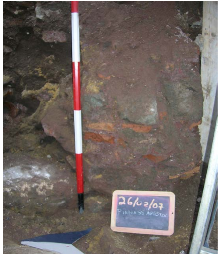
Fig. 7. La sezione Est del muro Nord.