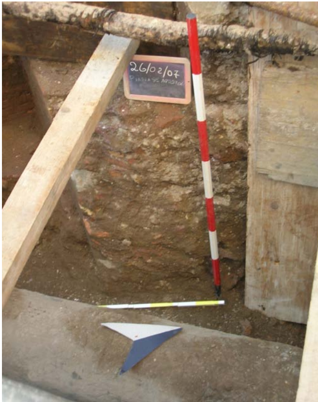
Fig. 6. La sezione Ovest del muro Nord.