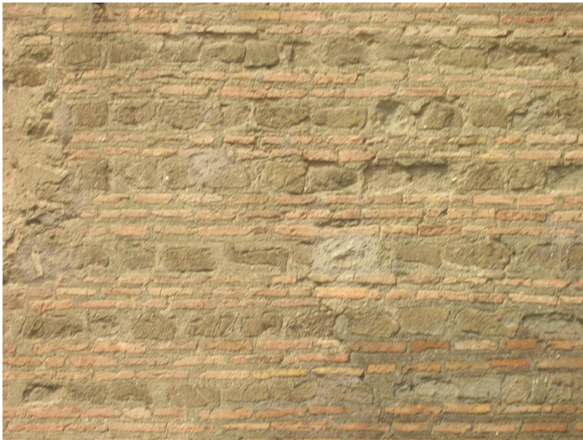
Fig. 9. La parete mediana della facciata esterna dell'atrio della Chiesa di S. Clemente.