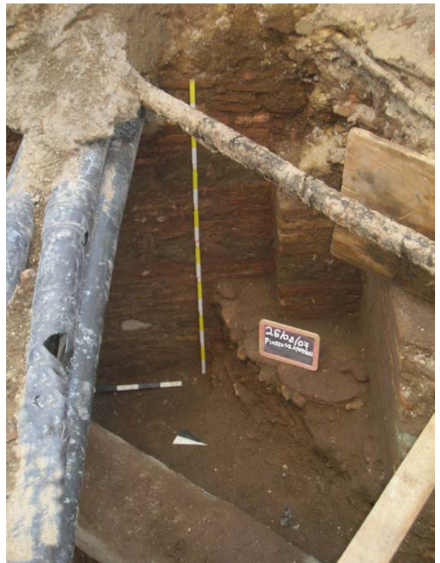
Fig. 2. Il muro Ovest.

Sul limite Nord dell'area di scavo, è visibile in sezione, un altro tratto dello stesso muro (lung. 0,40; larg. 0,60; h 0,80 m.), purtroppo molto danneggiato (fig. 7). Sull'angolo tra il limite Nord dell'area di scavo e la sezione Est del muro Nord, a una quota di m 16,68 s.l.m. (la stessa quota del pavimento in cocciopesto), al di sotto del muro è incassato un blocco in travertino (largh. 0,24x0,33; h 0,30 m.) di forma quadrangolare (fig. 8).