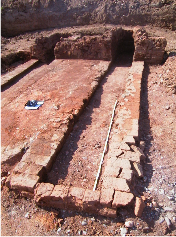
Fig. 2. Fornace G.

L'asportazione del riempimento macerioso ha messo in luce due prefurni con relativi canali di irradiazione e tra questi la superficie basale della camera di combustione. I prefurni, paralleli e distanti tra loro 1,20 m hanno l'imboccatura esterna rivolta a ovest.