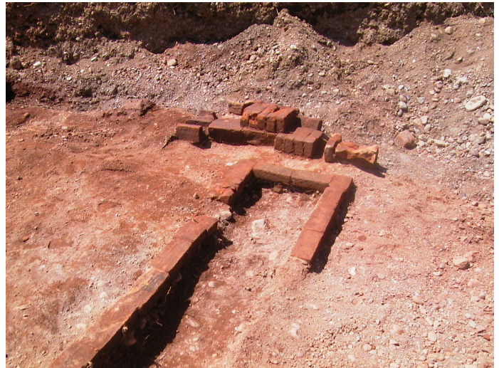
Fig. 5. Fornace M.

prefurnio doveva essere ad imbuto variando dai 0,70 m della parte finale ai 0,52 m della bocca di ingresso. Il riempimento interno è formato da sabbia e ghiaia rubefatta, mattoni e frammenti di mattoni di colorazione rosso vivo. Un possibile secondo prefurnio è indiziato dalla presenza a 2,45 m in direzione nord di una porzione di muro. Non è rimasta traccia della base del vano di combustione.