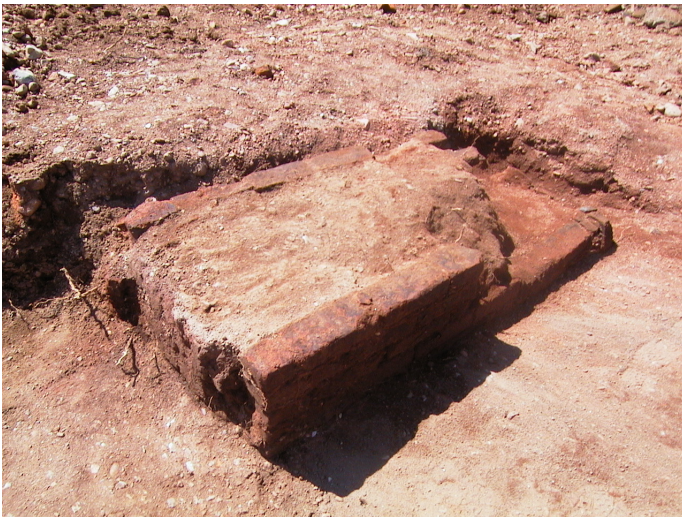
Fig. 4. Fornace L..