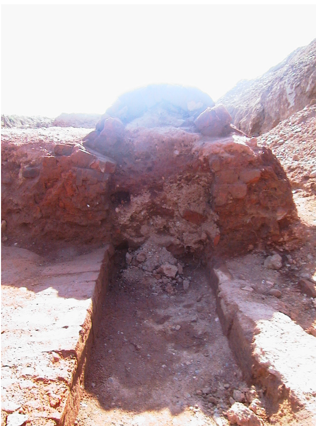
Fig. 3. Fornace H.

Orientata in senso NO-SE risulta troncata nella parte superiore; i prefurni sono alquanto compromessi e nel loro riempimento vi sono numerosi frammenti di mattoni provenienti dal crollo delle coperture.