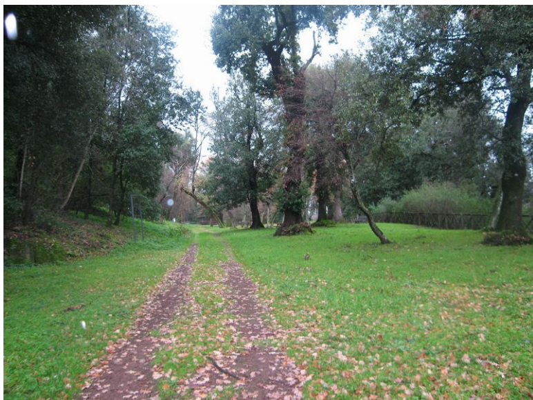
Fig. 3. Panoramica della c.d. Terrazza di Tempe.

mento e del personale di servizio (fig. 2).