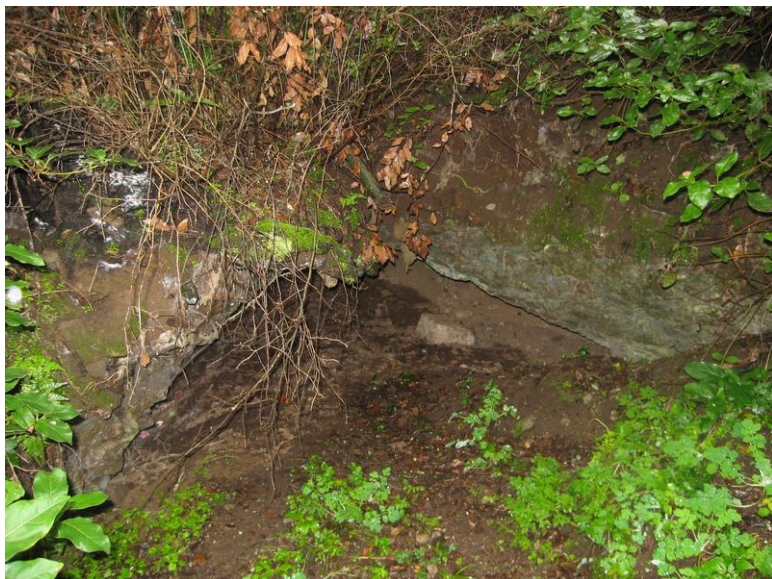
Fig. 4. La volta della nuova e presunta galleria carrabile.

Dopo pochi metri la galleria si biforca, per la presenza di un ramo che piega verso Ovest (fig. 6). La biforcazione presenta caratteristiche disomogenee tra i due angoli. Mentre il primo spigolo è arrotondato, per agevolare il senso di percorrenza verso Piazza d'Oro, il secondo forma un angolo acuto con la galleria principale che si sviluppa lungo l'asse Nord-Sud. In tal modo, si intendeva evidentemente precludere il transito ai carri provenienti da Piazza d'Oro verso il Grande Trapezio e viceversa (fig. 7). E' probabile che l'obbligo di ripassare sempre per la piazzola di sosta all'esterno del sistema sotterraneo per regolamentare il traffico veicolare, fosse finalizzato anche al controllo sulla consistenza numerica dei carri presenti all'interno degli assi viari e sulla distribuzione delle merci all'interno della Villa.