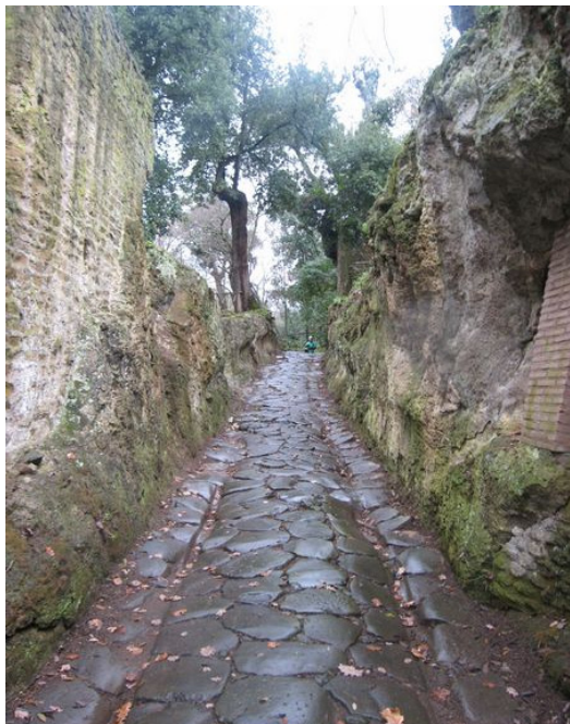
Fig. 2. Tratto di strada basolata che permette l’accesso alla c.d. Terrazza di Tempe.

In questo breve contributo intendiamo illustrare i principali risultati emersi dalla campagna di indagini sul sistema viario sotterraneo della Villa chiamato “Strada Carrabile” il quale permetteva di raggiungere il c.d. Grande Trapezio dall’esterno del complesso residenziale.