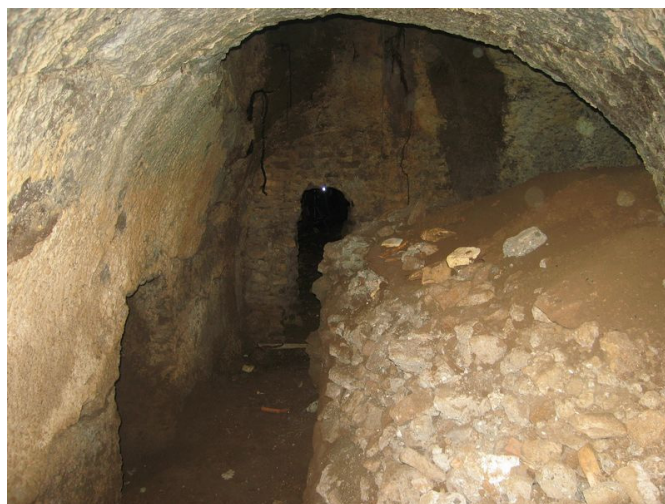
Fig. 9. La tamponatura che permette l'accesso alla galleria franata.