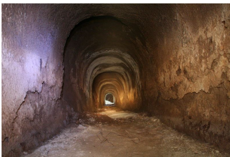
Fig. 10. La lunga galleria in direzione del c.d. Grande Trapezio.