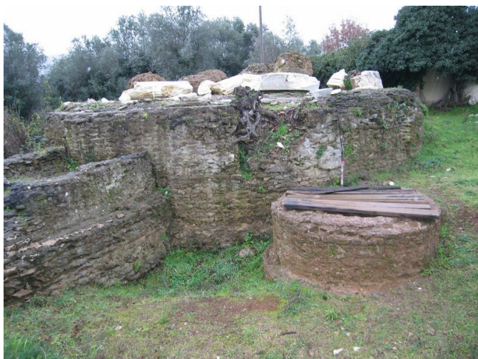
Fig. 8. Il pozzo adiacente al c.d. Sepolcro.