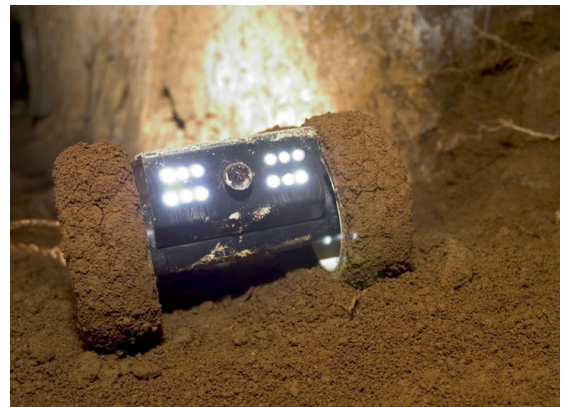
Fig. 1a. Robot filo guidato con doppia telecamera e trazione motrice sulle 4 ruote.

Un importante diverticolo stradale che da Via Tiburtina conduceva a Villa Adriana si diramava sicuramente da Ponte Lucano verso i Colli di S. Stefano; la strada, con ogni probabilità di origine repubblicana e a servizio della precedente villa su cui insiste la residenza adrianea, venne voltata artificialmente, almeno in alcuni tratti, verosimilmente per nascondere il transito dei carri di approvvigionamento.