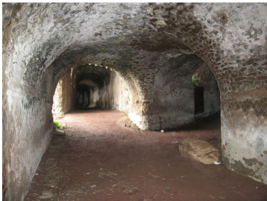
Fig. 6. Punto della biforcazione. Dritto al Grande trapezio, a Dx alla Piazza d'Oro.

to 3 , spesso circa 0,50 m, realizzato in blocchetti di tufo abbastanza irregolari. Il muro è stato costruito presumibilmente intorno agli anni Settanta, per creare un accesso al campeggio che all'epoca occupava la zona meridionale del complesso archeologico. Ciò è confermato dal fatto che sia Contini che Piranesi poterono percorrere questo tratto di strada fino alle vicinanze del c.d. Mausoleo, dove si dovettero fermare per la presenza di una grossa frana 4 , tuttora esistente. Ancora oggi l'esplorazione della galleria oltre la tamponatura è possibile solo utilizzando il pozzo immediatamente adiacente al "Mausoleo" (fig. 8) e tornando indietro in direzione Nord". L'ispezione della strada carrabile a partire da questa zona è resa particolarmente