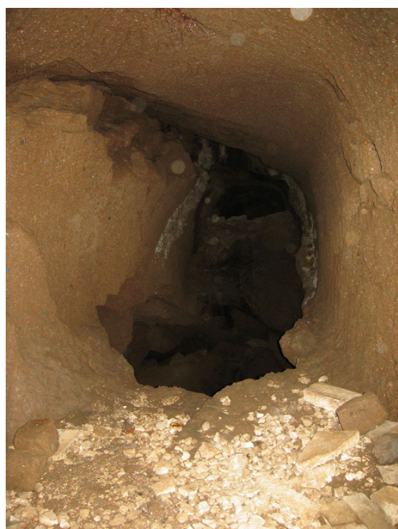
Fig. 11. Il crollo che ha causato la grande voragine sotterranea.

La frana è stata ispezionata con l'utilizzo di tecniche di progressione verticale speleo-archeologiche. Dalle indagini è emerso che questo tratto di dimensioni ridotte era una galleria-pilota, che ha presumibilmente intercettato, in fase di realizzazione, il grande ambiente caveale visibile poco più a Nord, sotto la c.d. Terrazza di Tempe (fig. 12). Il crollo accidentale ha determinato la modifica del progetto originario della strada, che fu deviata, con la realizzazione di un bypass, aggirando la voragine dal lato Est.