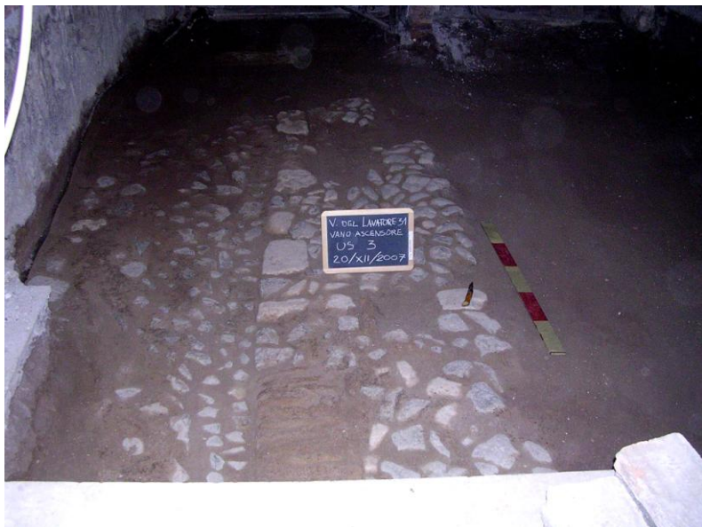
Fig. 6. Piano di acciottolato (US 3).

trasformazione, con la realizzazione del primo nucleo del palazzo odierno. Questo veniva a collocarsi nell'ambito dell'area di influenza della famiglia Colonna, che controllava dalla metà del XIII secolo il territorio cittadino compreso tra le pendici del Quirinale, Montecitorio e il Mausoleo di Augusto. La presenza negli strati di livellamento di questo periodo dei frammenti di un piatto e una brocca in maiolica riportanti lo stemma di questa famiglia ne è una conferma (fig. 7) 13 .