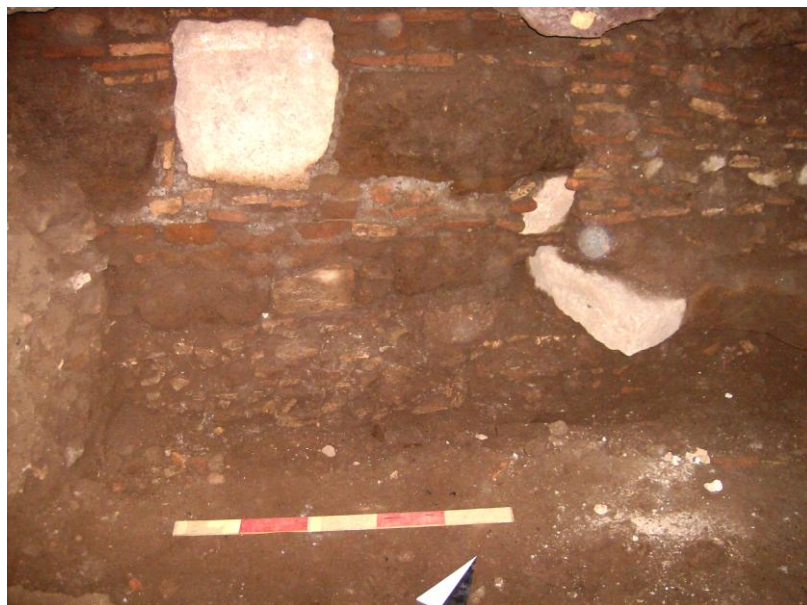
Fig. 3. Particolare USM 12.