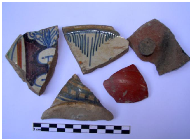
Fig. 7. A sinistra frammento di piatto con stemma dei Colonna.

Le murature del XII e del XIII secolo dimostrano insieme a quelle rinvenute presso l'ex-cinema Trevi, che la ripresa dell'attività edilizia attestata in tutta la città abbia coinvolto anche quest'area 12 . Alla fine del XV secolo - inizi XVI secolo infine l'area in corrispondenza di via del Lavatore n. 31 subisce una radicale