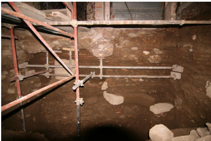
Fig. 4. UUSSMM 10 e12.