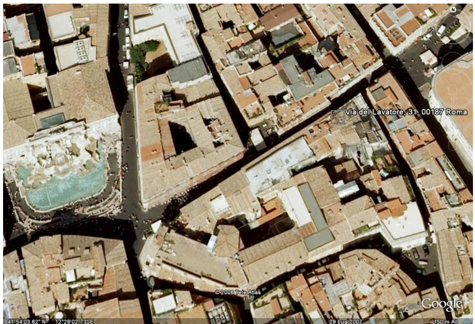
Fig. 1. Edificio in Via del Lavatore n. 31 nell'atlante telematico.

Dal 12 dicembre 2007 al 25 Gennaio 2008 su prescrizione della Soprintendenza Speciale per i Beni Archeologici di Roma (SSBAR) sono stati condotti lavori di scavo con assistenza archeologica nel palazzo sito in via del Lavatore n° 31 (fig. 1) 1 . L'area di scavo occupava la parte più interna dell'atrio del palazzo su via del Lavatore, in cui era prevista la realizzazione di un ascensore. Si è potuto così indagare la stratigrafia al di sotto della pavimentazione moderna fino ad una profondità di -2,85 m dal livello stradale e ricostruire le trasformazioni subite dall'area dal XII secolo fino all'età moderna (fig. 2).