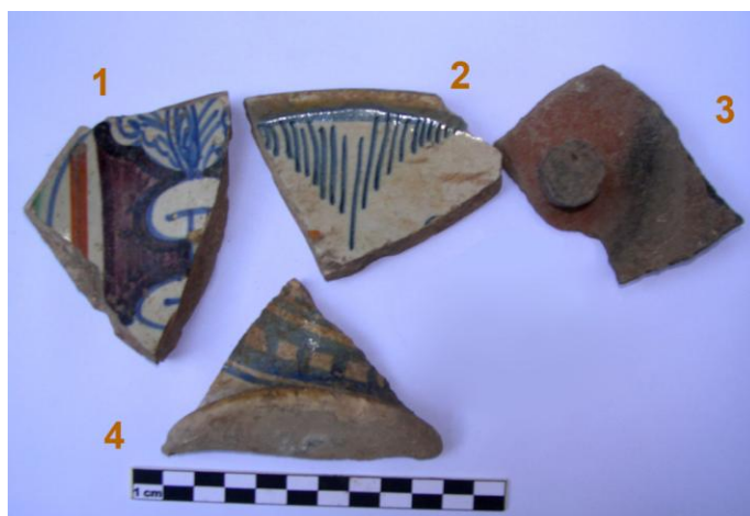
Fig. 6. US 9. Maiolica rinascimentale.

(Fig. 7.1) Frammento di ciotola carenata con piede a disco, decorato con linee concentriche, color senape, blu e verde ramina.