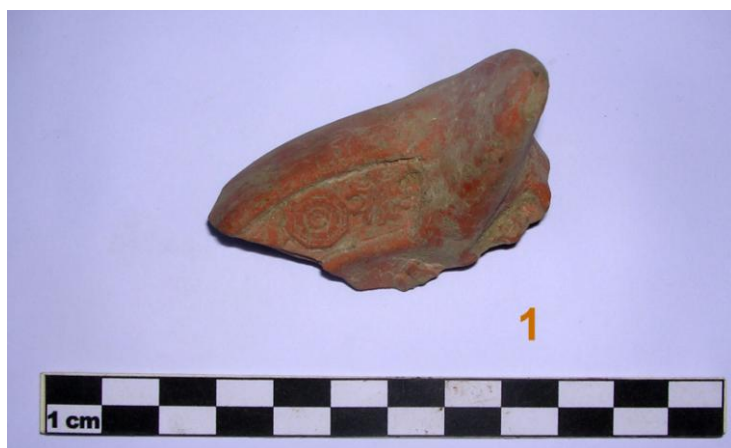
Fig. 3. US 20. Lucerna in terra sigillata africana.

Seconda metà del XV-primi del XVI secolo.