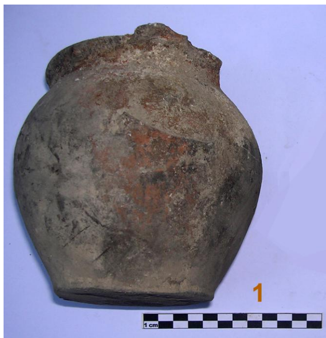
Fig. 5. US 11. Ceramica invetriata da fuoco.