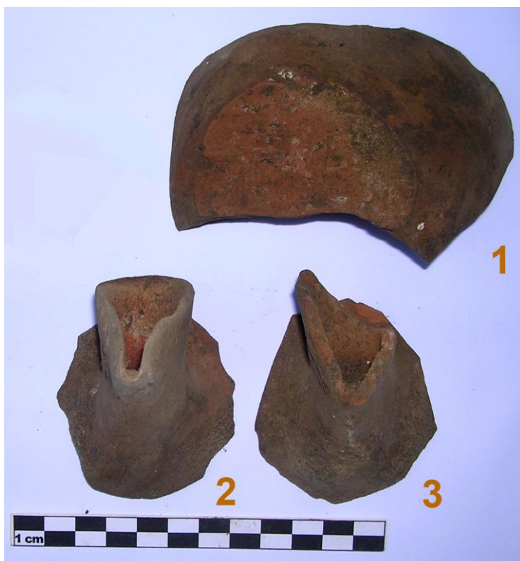
Fig. 4. US 20. Ceramica a vetrina sparsa.