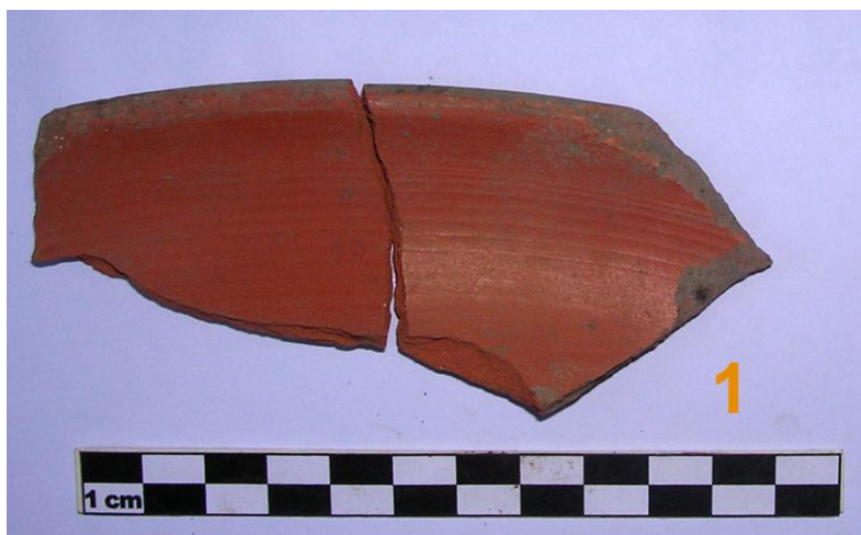
Fig. 1. US 18. Scodella in Terra sigillata africana C.

PAROLI 1990: 337, n. 338; Tav. XLIII, 338. Fine XII-inizi XIII secolo.