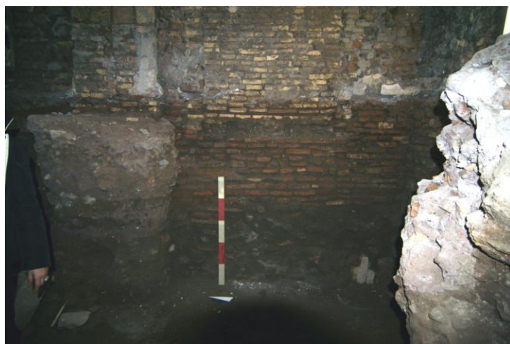
Fig. 5. USM 2.

invariata fino ad oggi. La stratigrafia relativa a questa attività di riempimento (UUSS 7-9) è riferibile ad una cronologia rinascimentale (fine XV-inizi XVI sec.) 8 . Il piano di calpestio era costituito in parte da un acciottolato (fig. 6) e in parte da mattoni in cotto.