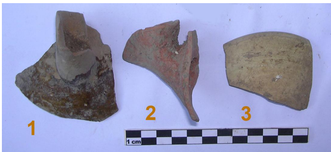
Fig. 2. US 18. Ceramica a vetrina sparsa e acroma depurata.