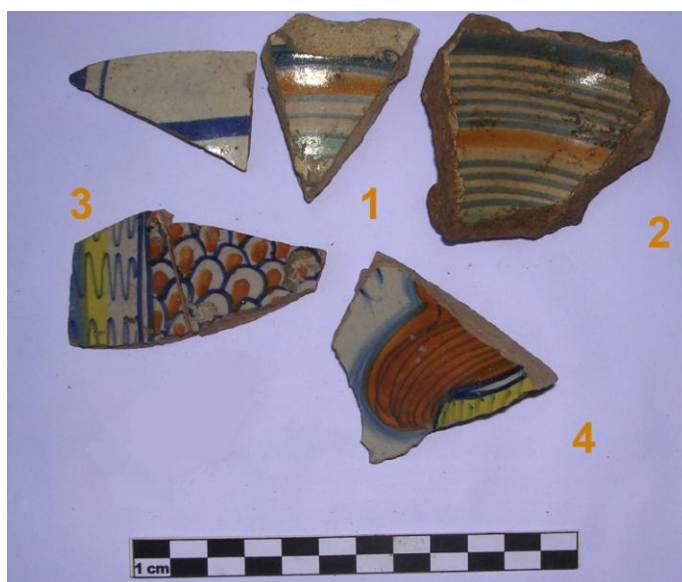
Fig. 7. US 9. Maiolica rinascimentale.