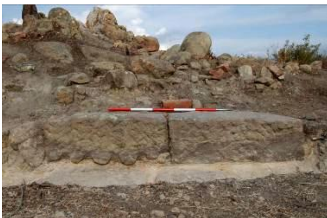
Figg. 4 a-c. Muro di contenimento nord-est (MK9-3): a) tratto nord, b) roccia nella parte centrale, c) tratto sud.

Il muro di terrazzamento nord-est: MK8-1 (tratto sud-est); MK9-3 (tratto nord-ovest)