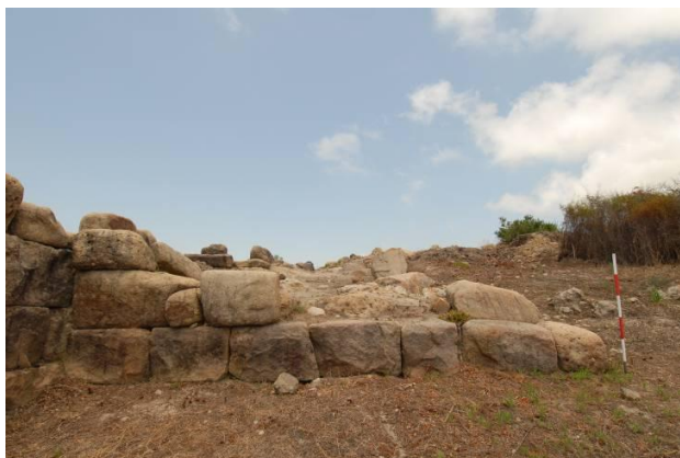
Figg. 5a-c. a) MK8-2 (nicchia?); b) cd. Propylon; c) MK8-16 Muro di contenimento visto da sud-ovest per una possibile via processionale.