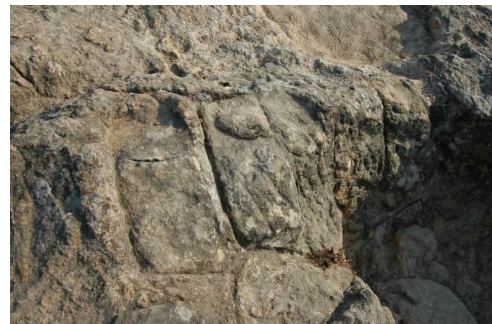
Fig. 17a-b. a) Cava all'aperto nella parte centrale; b) Tracce dell'estrazione dei blocchi nella zona del bacino.