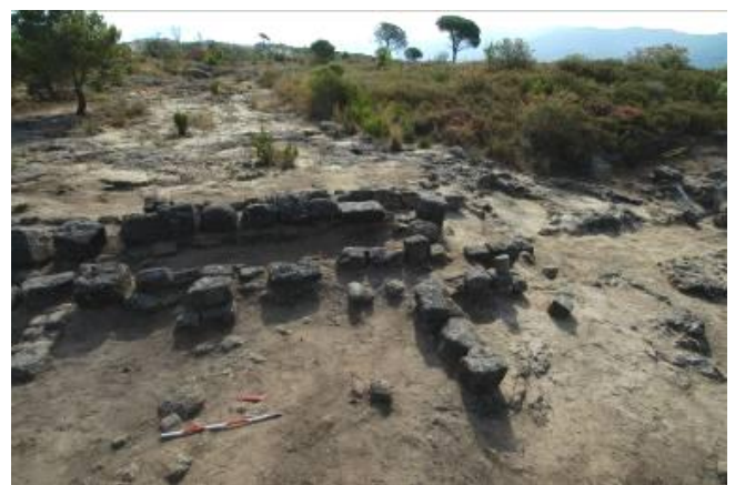
Figg. 8a-c. a) Angolo sud; b) Parte centrale; c) Lavorazione verticale della roccia a nord-ovest.