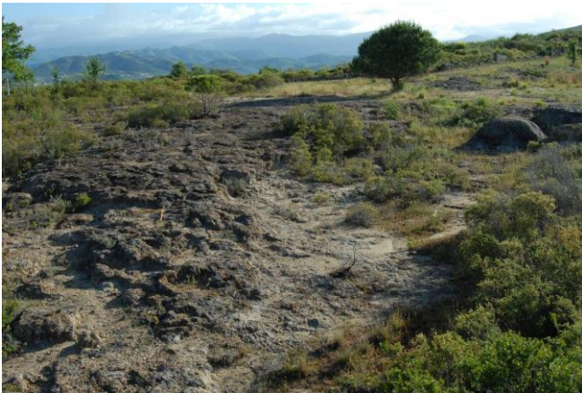
Fig. 16. Cava all'aperto nella parte centrale della terrazza di Zeus.

piccole pietre di arenaria che si alternano a mattoni velini. Di nuovo, l'utilizzo di questo materiale propone una datazione a non prima del III sec. a.C. 17 .