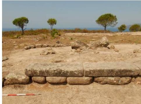
Figg. 14a-c: a) Taglio nella roccia (US 116/12N); b-c) Fondazione della parte sud nel lato nord-est (b) e nel lato sud-ovest (c) dell'altare.