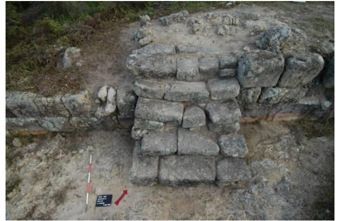
Figg. 7a-b. Lato sud-est della terrazza: gradinata d'accesso sul lato meridionale.