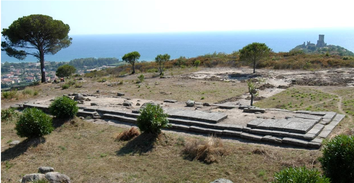
Fig. 13. Il grande altare della terrazza di Zeus, visto da nord (2012).