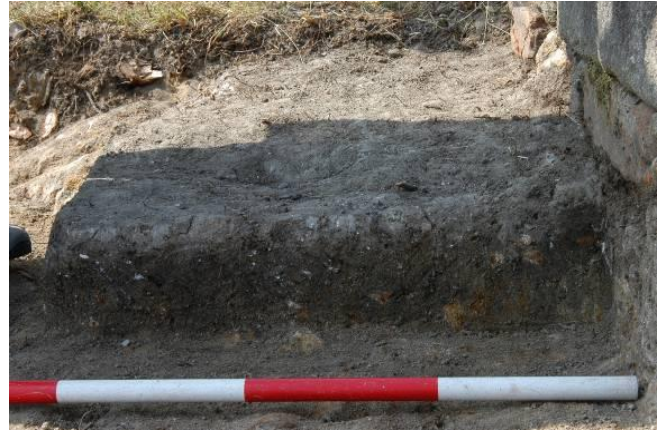
Fig. 15a-b. a) Blocco con incavo a fessura; b) Strato di carbone e di ossa calcinate a sud-ovest dell'altare.