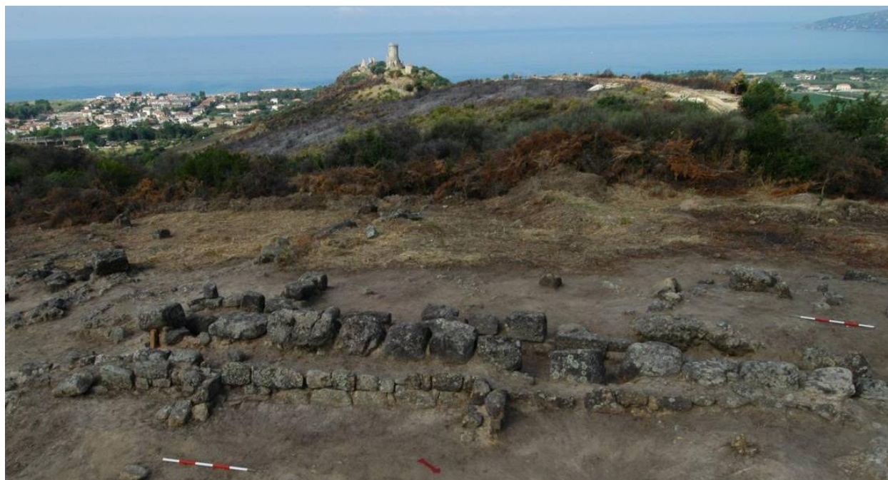
Fig. 9. Lato sud-ovest, parte media: fase di rifacimento in secondo piano con blocchi grandi.