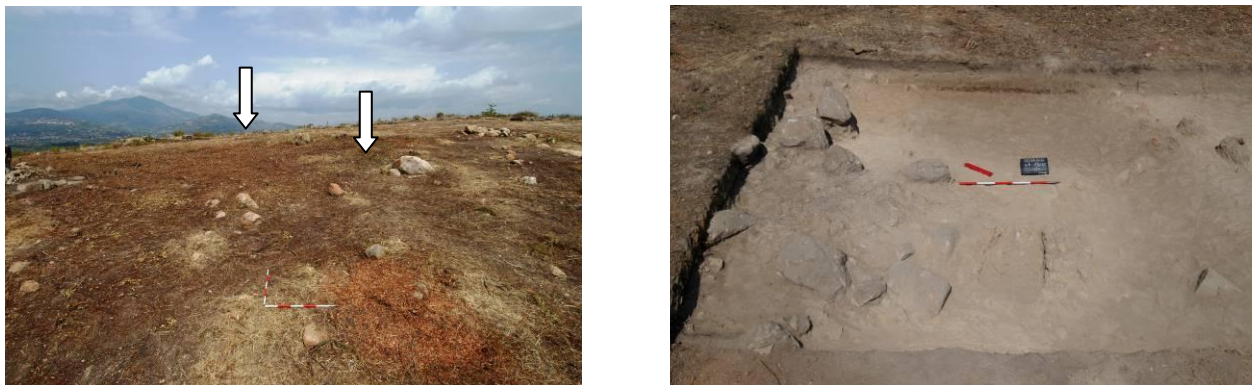
Figg. 19a-b. a) Possibile limite della terrazza a sud-ovest; b) Limite nord-ovest della terrazza sud (freccia a sinistra: K9-44, a destra K9-12).

La terrazza meglio esplorata è quella a sud ovest, per cui i saggi del 2012 e 2013 hanno chiarito che si trattava di un terrazzamento scavato nella roccia affiorante che si estendeva con grande probabilità dal limite ovest fino a due punti caratterizzati da tagli artificiali (K9-12 a sud e K9-44 a nord) 24 . L'orientamento di questo terrazzamento evidentemente non corrisponde né a quello della grande terrazza di Zeus né a quello della cortina, ma segue la formazione naturale della roccia in quest'area (fig. 19a).