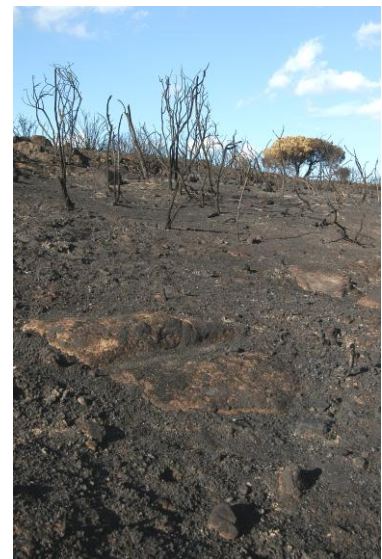
Figg. 1 a-b. Area sacra n. 9 (a) ed zona adiacente a nord-est (b) dopo l'incendio del settembre 2007.

I lavori nell'ambito del progetto di 2008 però hanno permesso di esplorare solo la parte vicino la cinta muraria, con la grande sala-stoà nella parte nord-est (21 x 6,50 m) e un recinto con una cisterna e la base per una colonna, mentre hanno lasciato fuori la zona a sud-ovest.