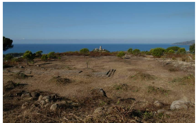
Figg. 3a-b. a) La terrazza di Zeus vista da est; b) La terrazza all'inizio dei lavori nel 2011.