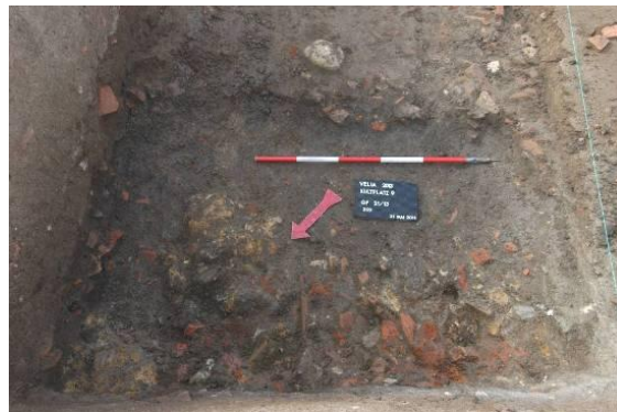
Fig. 21a-b. a) Strato di laterizi, saggio 17/12; b) Saggio 21/13.

Il repertorio dei materiali contenuti in questi strati si presenta molto peculiare, consistendo soprattutto in pentole e frammenti di anfore del tipo MGS V/VI che si riferiscono forse a pasti rituali nel santuario. Di interesse particolare sono un frammento di braciere con maschera di sileno (fig. 22a) che ad Atene non si data prima del secondo quarto del II secolo a.C. e un guttus quasi intero del tipo ad anello (fig. 22b) depositato evidentemente in modo intenzionale.