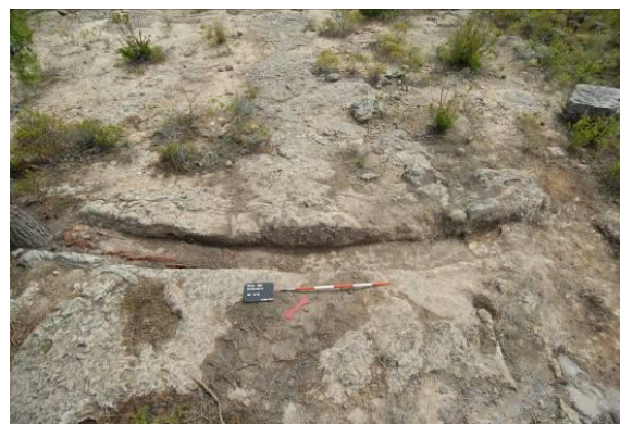
Figg. 18a-b. a) Canaletta del lato sud; b) Canaletta al lato ovest della terrazza di Zeus (saggio 5/13).