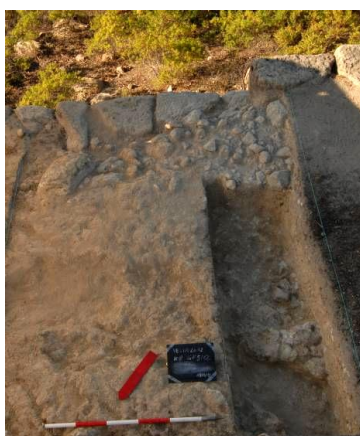
Figg. 6a-b. a) angolo sud della terrazza; b) saggio 5/12.