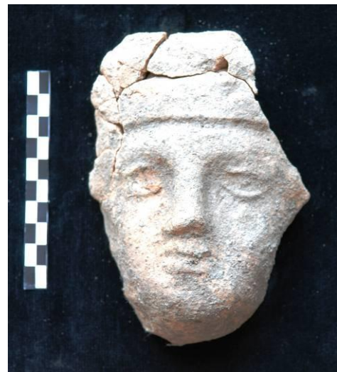
Figg. 23a-b. a) Antefissa del tipo con calice spinoso; b) Antefissa: testa femminile.