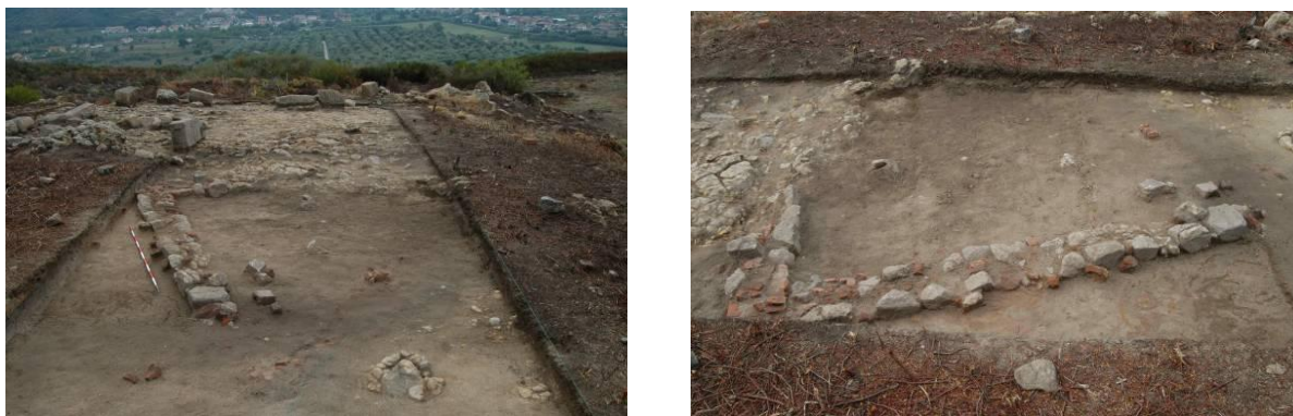
Figg. 20a-b. L'edificio MK9-2 da nordovest (a) e da nord-est (b).

In questa zona gli scavi del 2011 hanno portato alla luce due vani (MK9-1; MK9-2) di cui si sono conservate soltanto le fondazioni dei muri verso nord-ovest e nord-est, mentre mancano le tracce dei loro limiti verso sud-ovest e sud-est e anche tutte le indicazioni per la posizione dell'entrata. Quasi tutti i muri poggiano direttamente sulla roccia naturale e non presentano una sequenza stratigrafica. Il loro orientamento è significativamente diverso da quello della terrazza di Zeus.