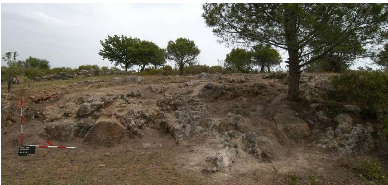
Fig. 10. Lato ovest della terrazza di Zeus: parte sporgente.

Dalle indagini di quest'anno risulta però che la situazione è molto più complessa, perché anche in questa zona sono stati identificati tagli nella roccia appartenenti a diversi sistemi di orientamento, che corrispondono a quelli osservati nella campagna del 2008. Il profilo della parte sporgente della roccia è allineato con il profilo esterno del muro di terrazzamento sul lato sud-ovest, mentre la parte rientrante verso est riprende l'orientamento del rifacimento del lato sudovest 14 . In questo senso la discontinuità dell'andamento del lato sudovest della terrazza non sembra dovuta ad una funzionalità differente, ma probabilmente ha una spiegazione cronologica. Le "gradinate", ben riconoscibili nella roccia affiorante in questa zona, potrebbero così trovare una spiegazione come appoggio per i blocchi del muro di contenimento, oggi totalmente spoliato. Il problema dell'accesso alla terrazza da ovest rimane purtroppo aperto.