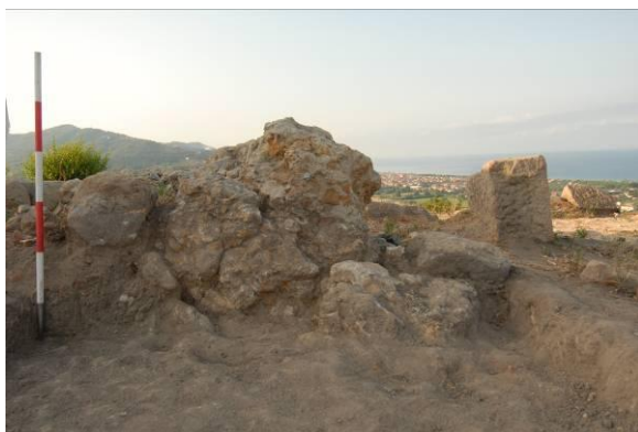
Figg. 24a-b. a) Blocchi parallelepipedi (US 602/11); b) Taglio verticale nella roccia nel saggio 13/12.

intuire qualche rito connesso con queste attività forse nel senso di un rito di chiusura. Per la costruzione del santuario nella sua prima fase abbiamo un terminus ante quem intorno alla prima metà del II secolo a.C. con il braciere con maschera di sileno. L'uso frequente di mattoni cotti propone una datazione non prima del III sec. a.C.