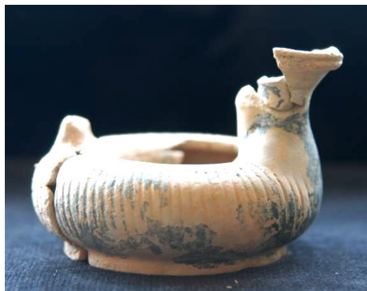
Fig. 22a-b. a) Braciere con maschera di sileno; b) Guttus del tipo ad anello.

Sono stati rinvenuti anche moltissimi frammenti di tegole di varia provenienza: accanto a prodotti locali sono state identificate importazioni da varie officine, probabilmente da localizzare all'interno della baia di Napoli. Fra questi si trovano anche frammenti di tre antefisse (fig. 23a), una del ben noto tipo a fiore con calice spinoso e corolla compatta, forse un cardo 30 , le altre due a testina femminile probabilmente prodotte nell'area campana (fig. 23b). La presenza di questi elementi pertinenti a tetti sono l'unica testimonianza per l'esistenza di edifici di cui però non sono state riscontrate tracce né negli scavi attuali né in quelli anteriori.