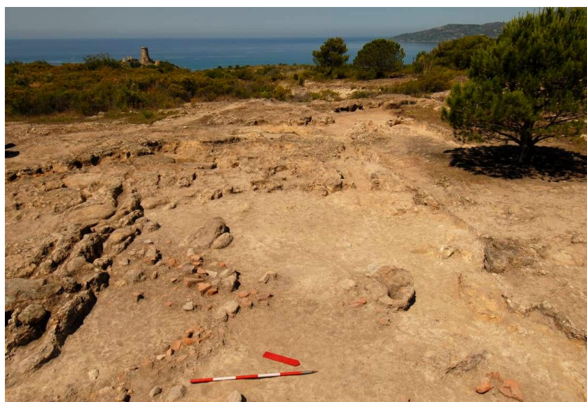
Fig. 12. US 355/12: fondazione(?) di un muro/edificio.

In un altro tratto del banco roccioso sono state individuate anche le tracce di semplici strutture. Si tratta di fondazioni in laterizi, per lo più molto alterate e rimaneggiate. Soltanto in un unico caso le tracce si sono conservate per una lunghezza di 2,8 m circa (US 355/12). L'uso di mattoni cotti, cd. Velini, data questa struttura a non prima del III sec. a.C. (fig. 12).