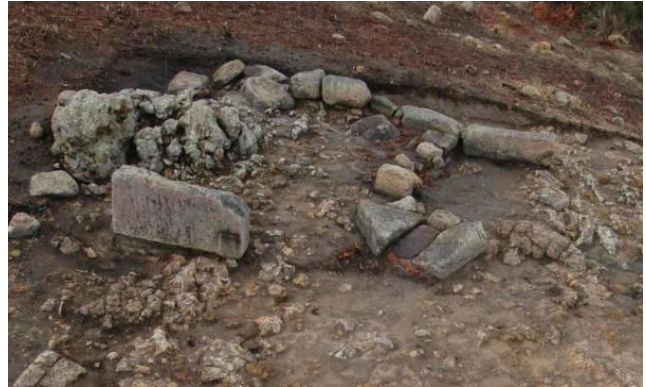
Figg. 25a-b. a) MK9-1: edificio tardo-antico? da nord; b) MK9-1 da sud ovest.

I suoi muri nord ed est sono costruiti da blocchi di arenaria riutilizzati. Anche in questo caso la ricostruzione dell'edificio si basa sulle tracce di una sottile fossa di fondazione per la continuazione del muro nord la quale taglia in modo ben riconoscibile il muro sud-est del vano più antico MK9-2, mentre la posizione dell'angolo sud-ovest di MK9-1 viene indicata da tagli nella roccia affiorante. In questo modo si ricostruisce un edificio con le misure di almeno 11 x 7 m e con una divisione interna in un piccolo vano con le misure di 3 x 7 m a nord e un vano più grande a sud. La zona a nord di MK 9-1 è stata utilizzata anche in questa fase per strutture di difficile interpretazione come quattro strutture a pianta circolare, costruite con frammenti di laterizi.