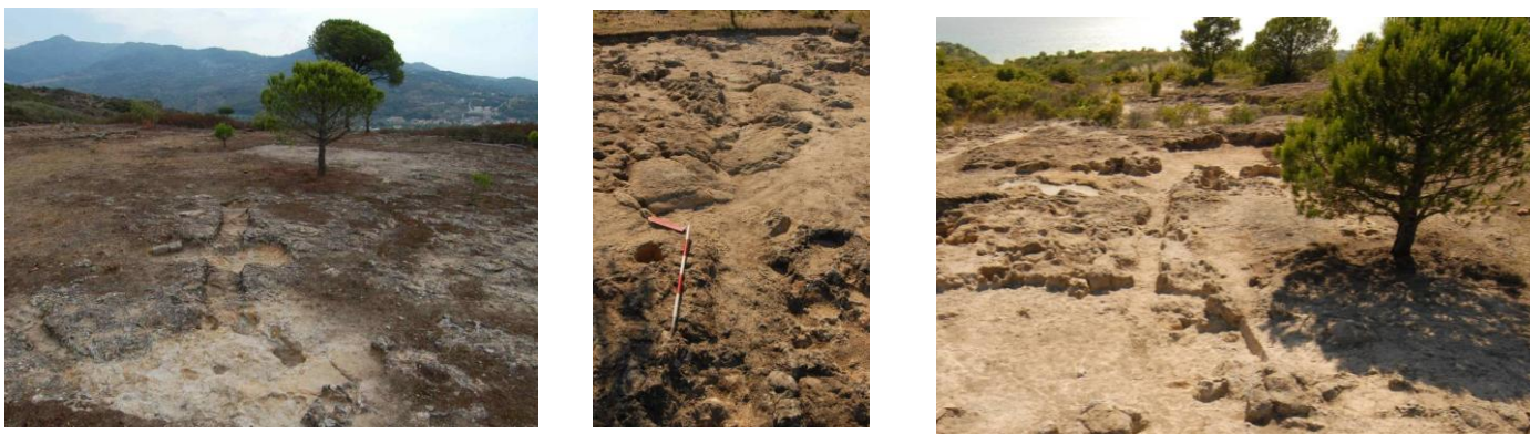
Figg. 11a-c. a) Fossa MK8-13; b) Fossa US 304/12N; c) Fossa MK8-10.