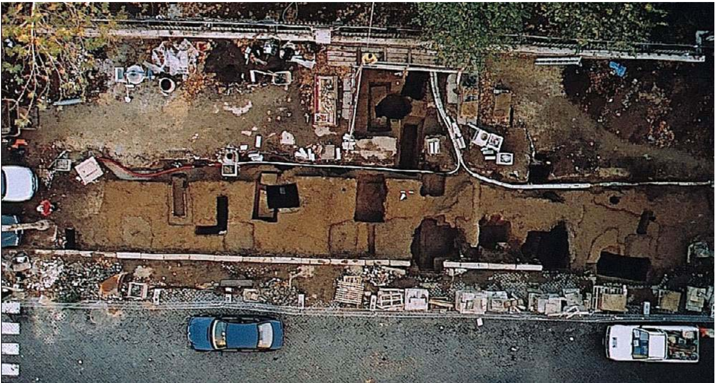
Fig. 3. Veduta dal pallone frenato delle tombe della necropoli esquilina.

Alla suggestiva visione dall'alto della fascia di necropoli sul lato breve in direzione di via dello Statuto, fa riscontro l'estremo interesse del vasellame miniaturistico rinvenuto in contesto che, pur consistente in un esiguo numero di pezzi, suggerisce precisi termini cronologici, oltre a considerazioni relative alle aree ed ai modi di produzione. La necessità di concludere i lavori di ripavimentazione ha costretto a ricoprire i resti rinvenuti, ma è in corso di definizione con l'Amministrazione comunale la realizzazione di allestimenti didattici in loco, allo scopo di restituire alla collettività la conoscenza della storia stessa di Piazza Vittorio.