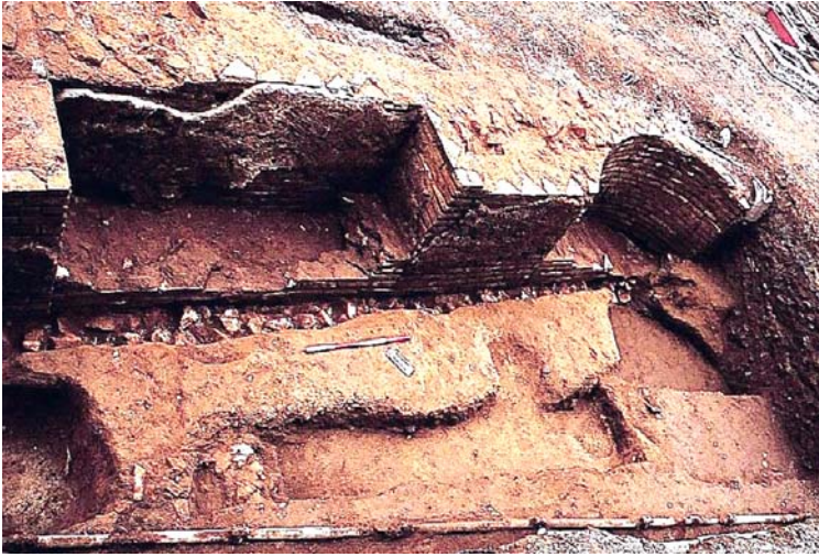
Fig. 2. Piazza Vittorio. Prospetto architettonico con nicchie, sul lato in direzione delle vie Mamiani e Ricasoli (lettera C in fig. 1).

porzione significativa della necropoli, in particolare della fase "oscura" dei decenni tra il VI e il V secolo a.C. quando, in esito a disposizioni di natura suntuaria, si abolì o limitò fortemente l'uso di accompagnare con corredo la deposizione del defunto.